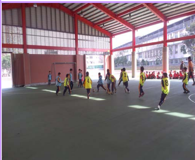
說明：三年級足球賽