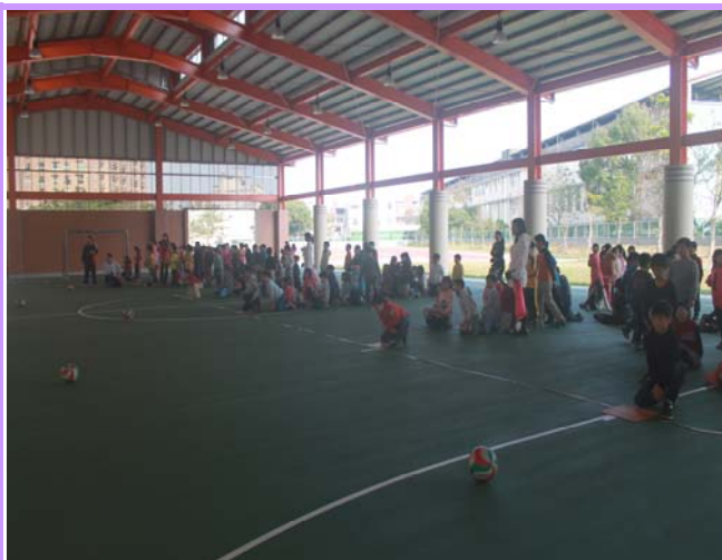
說明：二年級滾球賽