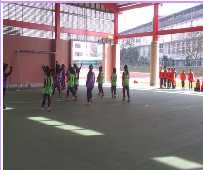
說明：三年級足球賽-進球了!